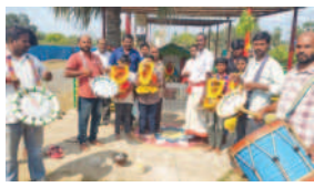
మొగల్తూరు, మార్చి 12, (ఆంధ్ర ప్రభ): మొగల్తూరు పంచాయతీ కుక్కలవారితోట గ్రామంలో వేంచేసి యున్న చెట్టుకింద ముత్యాలమ్మ అమ్మ వారి జాతర మహోత్సవాల ప్రారంభం

మయ్యాయి. గ్రామ సంఘం అధ్యక్షుల లో ప్రతి ఏటా ఉగాది సమయంలో ఈ అమ్మవారి జాతర నిర్వహించడం ఆనవాయితీ. జాతర మహోత్సవాల్లో బాగాం బుధవారం అమ్మవారి ఆలయం వద్ద పందిర నిర్మాణానికి శంకుస్థాపన చేసి అమ్మవారికి పూరి గుడిసె నిర్మించారు. గ్రామంలో అమ్మవారికి హారతులు ఇచ్చి గ్రామోత్సవం నిర్వహించారు. నిర్వాహకులు, భక్తులు పాగొన్నారు